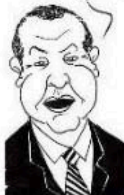
و شي قومي