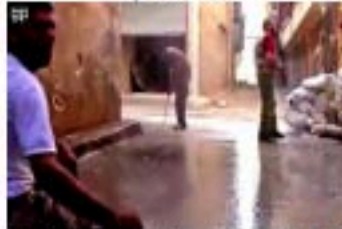
9- ثبات وإقدام رغم سقوط أختنا شهداء