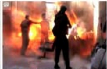
11- ولا تحسبن الذين قتلوا في سبيل الله أمواتا