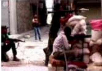
4- أثناء أداء فريضة الصلاة