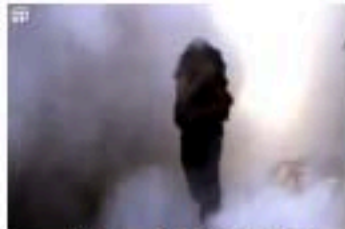
13- ونودع أغلى ما لدينا ونحسبهم عند الله شهداء