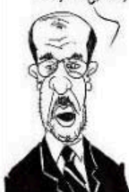
و شي عربي

وكلهم تدخلوا في سوريا عسكريا وسلحوا النظام