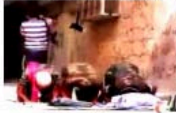
7- عودة للمرابطة