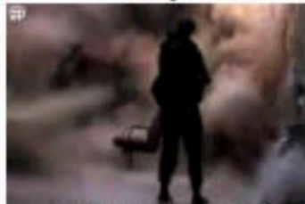
12- وتختلط العياء الطاهرة بالدعاء الطاهرة