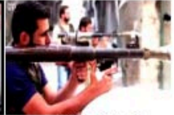
2- عند تناول الفطور