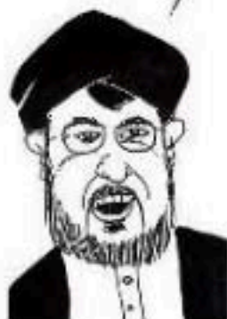
و شي شيعي