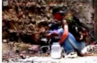
6- النظافة من الإيمان هي تعاليم دين الإسلام