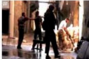
10- طلب الإسعاف