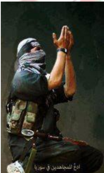
ادع للمجاهدين في سوريا