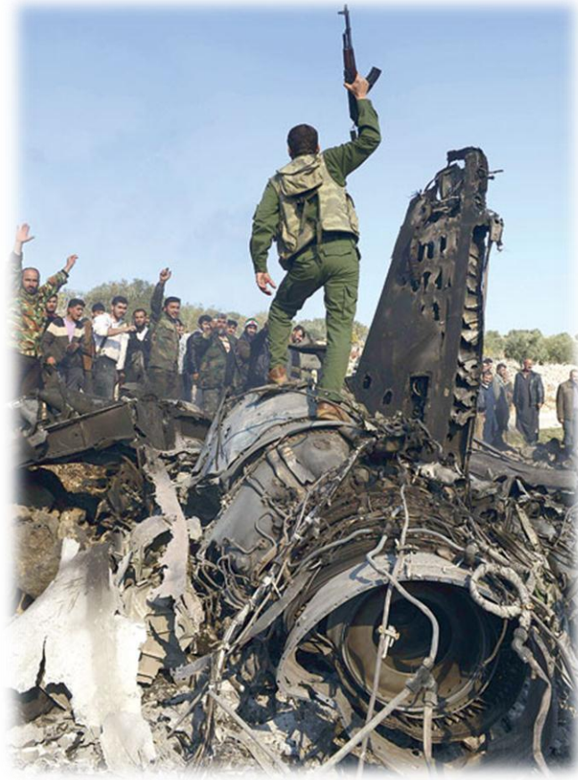
الصورة للطائرة التي سقطت على أرض ضيقتنا