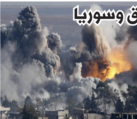
تابعة لتنظيم الدولة الإسلامية.

وقصفت أربع وحدات تكتيكية للدولة الإسلامية ودمرت تسعة مواقع قتالية ومركبة. وفي العراق نفذت أربع ضربات قرب كركوك ودمرت مواقع قتالية ومباني ومركبات ورشاشا ثقيلة وسيارة ملغومة محتملة كما قصفت وحدات تكتيكية. وأضاف البيان أن ثلاث ضربات نفذت قرب الفلوجة ودمرت مركبات ووحدات تكتيكية كما شن هجوم قرب الموصل واستهدف مركبة