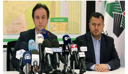
تمدن | يسار الدمشقي

واعتبر إيران وبحسب القوانين الدولية قوة احتلال بسبب سيطرتها العسكرية على عدد من المناطق من بينها العاصمة دمشق، إضافة إلى وجود مجموعات مسلحة تساعد في سيطرتها من لبنان والعراق وأفغانستان. إلى ذلك بدأ معارضون سوريون باستخدام مصطلح "الاحتلال الإيراني" لوصف الوجود