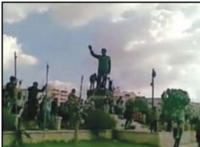
أثناء أسقاط صنم المقيور حافظ في بداية الأحداث في درعا

الطوارئ في البلاد بعد 48 عاماً متصلة من فرضها. في 25 أبريل أطلق الجيش السوري عمليات عسكريات واسعة في درعا ودوما هي الأولى من نوعها، وأدت إلى مقتل عشرات الأشخاص تقول المنظمات الحقوقية أن معظمهم من المدنيين جراء حصار وقصف المدينتين والقرى المحيطة بهما. وبعدها بأسبوع فقط بدأ الجيش عمليات أخرى في بانياس، ثم بعدها بأيام في حمص، متسبباً بمقتل المزيد من المدنيين. في 14 مايو بدأ الجيش حملة مشابهة على تلك الخ