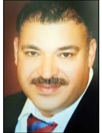
الفنان السوري مازن التاطور

تلك الاعمال لا تفيد الثورة السورية أو الشأن العام بشيء ... وبأن أعمال كتلك وفي هذا التوقيت وظيفتها الوحيدة هي نثر الرماد في العيون .. والإيحاء بأن سوريا بخير وكل شيء يجري فيها كالمعتاد ... وهذه طبعاً هي مقولة النظام ، انه خلصت وسوريا بخير . وتحدث ايضاً في منشور سابق عن جبهة النصرة قائلاً: شناعة النظام بدها الف جبهة مثل جبهة النصرة ، رغم جهلي بها . بشاعة النظام .. بدها رايات مثل الكحل ... مو بس رايات جهادية سوداء ... رجس ودنس وعفن ووتن النظام اللي مكخ من نص قرن ، بده كل محيطات وبحار وانهار ، وامطار الكون ولمدة قرن كامل ، لتطهير سوريا من آثاره فحاجة تهويل وتخويف ، اي حدا رح يجي بعده ، رح يكون ملانكه جنبه وفي النهايه بئس الدراما وبئس الأعمال الدرامية التي لا تعكس الهم الأكبر ، والاعظم التي يعيشه الوطن ..