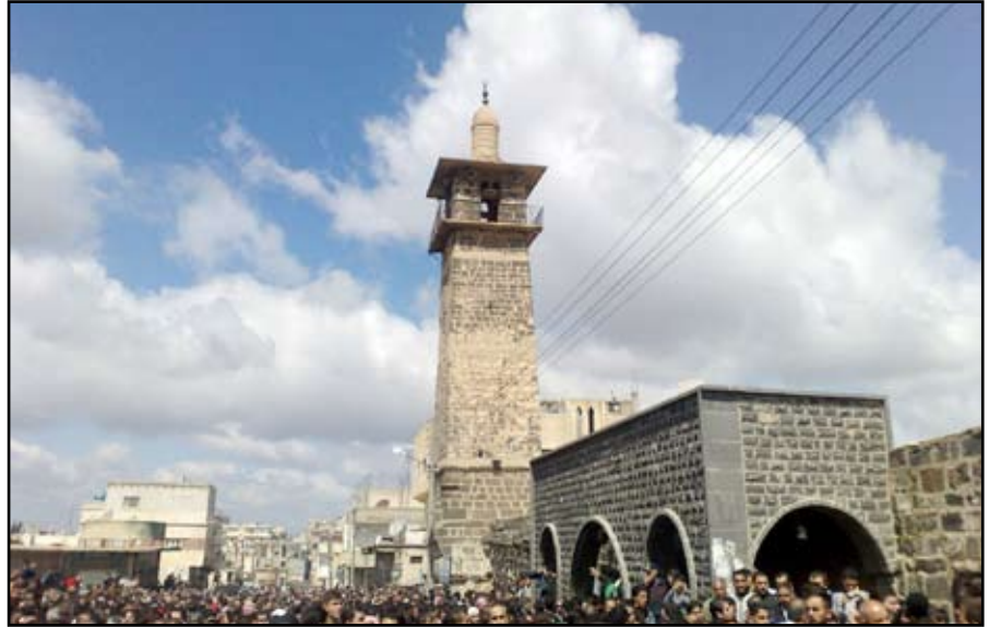
المسجد العمري وجموع المتظاهرين أمامه في بداية الثورة

لاشك بأن الشعب السوري كان يعيش حالة احتقان