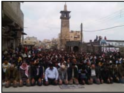
جموع المتظاهرين أثناء إقامة الصلاة في ساحة الجامع العمري

الطوارئ في البلاد بعد 48 عاماً متصلة من فرضها. في 25 أبريل أطلق الجيش السوري عمليات عسكريات واسعة في درعا ودوما هي الأولى من نوعها، وأدت إلى مقتل عشرات الأشخاص تقول المنظمات الحقوقية أن معظمهم من المدنيين جراء حصار وقصف المدينتين والقرى المحيطة بهما. وبعدها بأسبوع فقط بدأ الجيش عمليات أخرى في بانياس، ثم بعدها بأيام في حمص، متسبباً بمقتل المزيد من المدنيين. في 14 مايو بدأ الجيش حملة مشابهة على تلك الخ