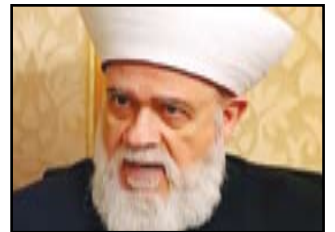
مفتي لبنان الشيخ محمد رشيد قباني

بشار الأسد، قائلًا: «نحن مع الشعب السوري وثورته، ولسنا مع النظام ولا مع إيران ومخططاتها التوسعية». ونقلت صحيفة «الأنباء» الكويتية قول قباني: «إن التواصل بيني وبين مفتي سوريا وقياداته الدينية مقطوع منذ اغتيال رئيس الوزراء اللبناني رفيق الحريري». وأيد قباني سياسة النأي بالنفس المتعمدة من الحكومة اللبنانية حيال الأزمة السورية، مشيرًا إلى تآكل مؤسسات الدولة اللبنانية، ما يجعلها عاجزة عن تقديم الإغاثة الشاملة لآلاف النازحين السوريين. وعقب قباني على