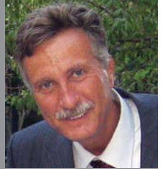
الشهيد معن العودات

حمزة ، من على أكفك يخرج الغمام ، أما بنادقهم فترحال جهام ، وخوف ، شمسك ستجفف الحقد في قلوبهم . في المعتقل نسجت لشبابنا وطناً حراً ، وفي استشهادك رسمك الوطن قبلة ، معن شكراً لأنك الحرية في باحة الألم .