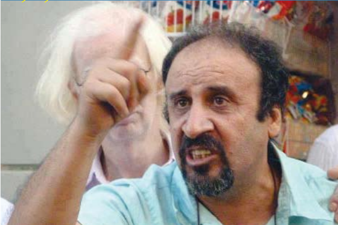
المخرج الأردني فيصل الزعبي