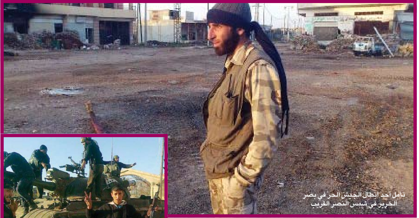
تأمل أحد أبطال الجيش الحر في بصر الحرير في شمس النصر القريب