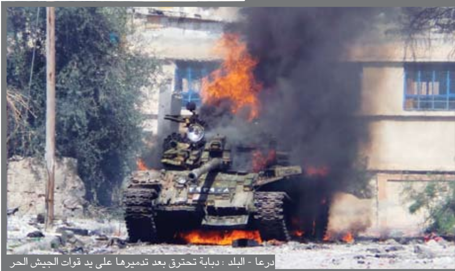
درعا - البلد : دبابة تحترق بعد تدميرها على يد قوات الجيش الحر