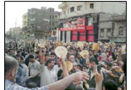
أثناء مظاهرة تنادي بأسقاط النظام في شارع الشهداء في درعا

الثورة السورية هي التي بدأت شرارتها في مدينة درعا حيث قام الأمن باعتقال خمسة عشر طفلاً على إثر كتابتهم شعارات الحرية على جدار مدرستهم بتاريخ 26 / 2 شباط. فبراير / 2011 م وفي خضم ذلك كانت هناك دعوة للتظاهر على الفيسبوك في صفحة لم يكن أحد يعرف من يقف وراءها استجاب لها مجموعة من الناشطين يوم الثلاثاء 15 آذار/مارس عام 2011 وهذه المظاهرة ضمت شخصيات من مناطق مختلفة مثل حمص ودرعا ودمشق لكن الانطلاقة الحقيقية للثورة السورية بمعناها الثوري كانت في درعا يوم الجمعة بتاريخ 18 / 3 آذار. مارس / 2011 م حيث سقط شهيدان هما حسام عياش ومحمود الجوابرة على إثر الاحتجاجات الشعبية العارمة في ذلك اليوم المشهود وكانت هذه الاحتجاجات ضد الاستبداد والقمع والفساد وكبت الحريات وعلى إثر اعتقال أطفال درعا والإهانة التي تعرض لها أهاليهم بحسب المعارضة السورية، بينما يرى مؤيدو النظام أنها مؤامرة لتدمير الممانعة العربية ونشر الفوضى في سوريا لمصلحة إسرائيل بالدرجة الأولى، وقد قام بعض الناشطين من المعارضة بدعوات على الفيس بوك وذلك في تحد غير مسبوق لحكم بشار الأسد متأثرة بموجة الاحتجاجات العارمة (المعروفة باسم الربيع العربي)، والتي اندلعت في الوطن العربي أواخر عام 2010 وعام 2011، وخصوصاً الثورة التونسية وثورة 25 يناير المصرية. وكانت الاحتجاجات قد انطلقت ضد الرئيس بشار الأسد وعائلته التي تحكم البلاد منذ عام 1971. وحزب البعث السوري تحت سلطة قانون الطوارئ منذ عام 1963. قاد هذه الاحتجاجات الشبان السوريون الذين طالبوا