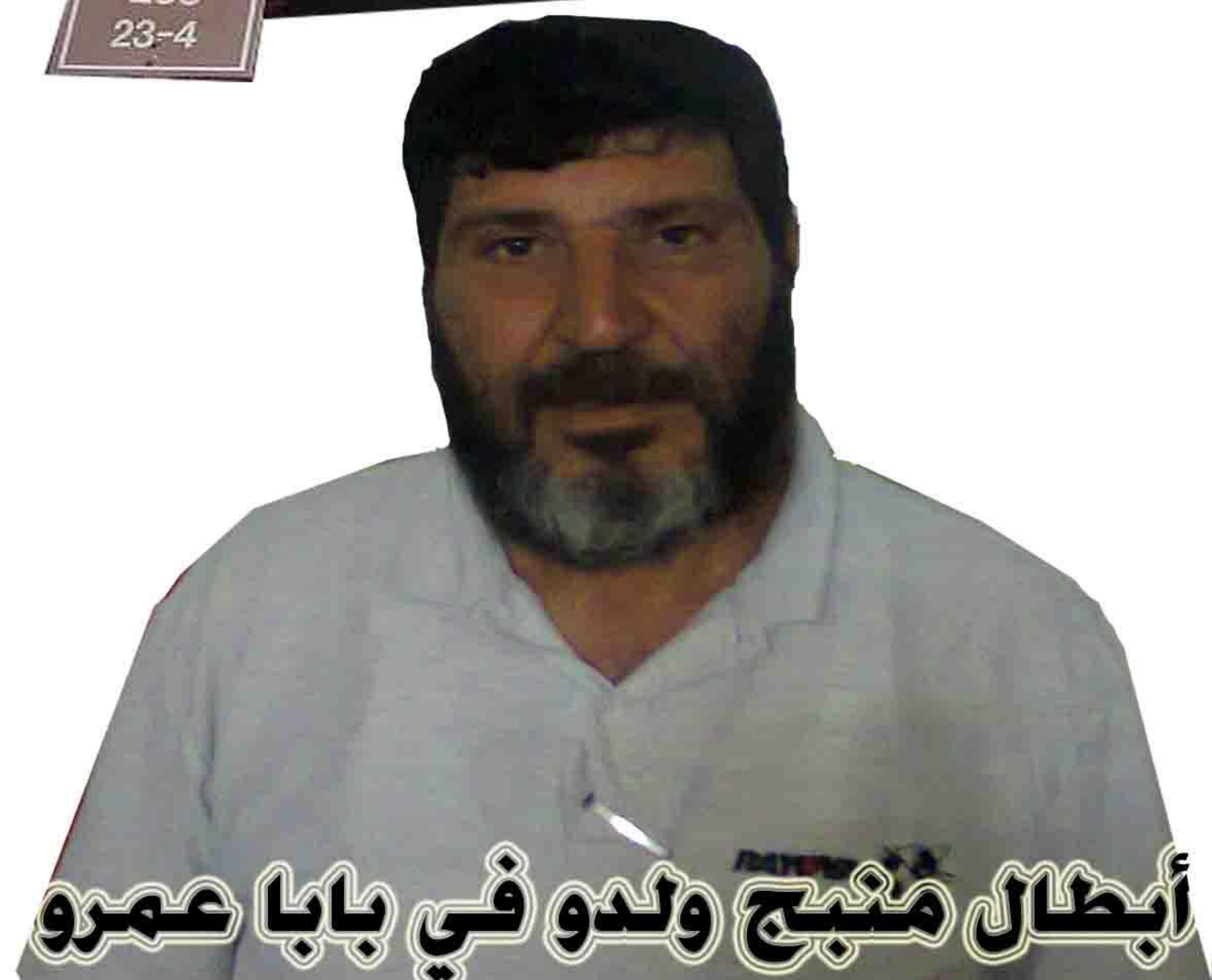
أبطال منبج ولدو في بابا عمرو