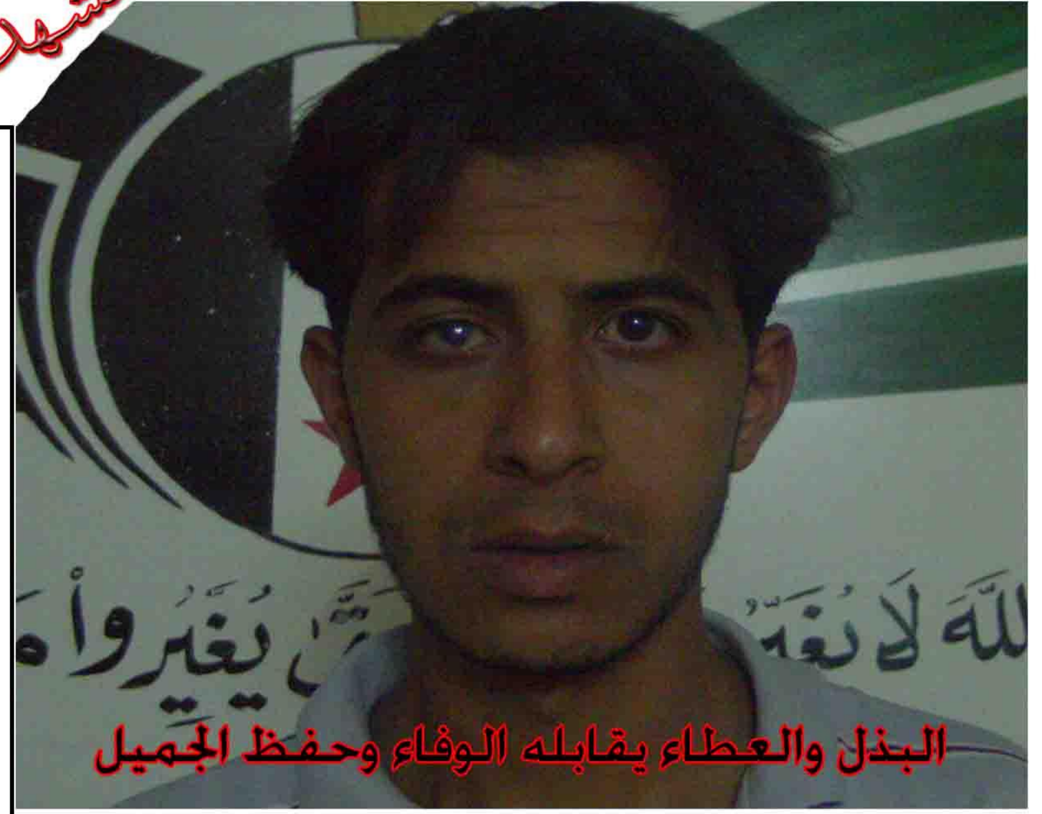
البذل والعطاء يقابله الوفاء وحفظ الجميل

عام مضى على تحرير مدينتنا منبج ونحن نتنفس عبق الحرية التي صنعتها سواعد وتضحيات هؤلاء الرجال والأبطال الذين ضحوا بالغالي والنفيس وبأعز ما يملك الإنسان من أجل أن ننعم بالأمن والأمان ولكي نسعد بحياتنا إلى تلك العيون الساهرة والسواعد السمراء القابضة على الزناد بمواجهة كل من حاول أو يحاول تعكير صفوا حياتنا ويستهدفنا بيوتنا ومدارسنا وأسواقنا ولو أستطاع أن يمنع عنا الماء والهواء لم يوفر وسيلة لقتلنا وقتل أمالنا وأطفالنا من الأسلحة الخفيفة إلى المتوسطة والثقيلة وأخيراً وليس آخراً تجاوز كل الخطوط الحمر التي رسمتها له دوائر القرار السياسي العالمي واستعمل لقتلنا الكيماوي والفسفوري والغازات المحرمة دولياً فماذا ننتظر من هكذا نظام بل هو غاشم احتل بلادنا وصادر قرارنا وتحكم بمصائرنا . لكنني أقول وكلي أمل بالغد المأمول من خلال نظرة الإصرار في عيون الأحرار من شبابنا المجاهدين الذين سطوروا أروع ملاحم البطولة والصمود والتضحية والفداء ومن ورائه شعب اتخذ قراره وشد كل أحزمة الإصرار والفداء من أجل أن يسعد هذا الشعب ويحقق ما يريد من حرية وعدل وكرامة ويقول الشاعر