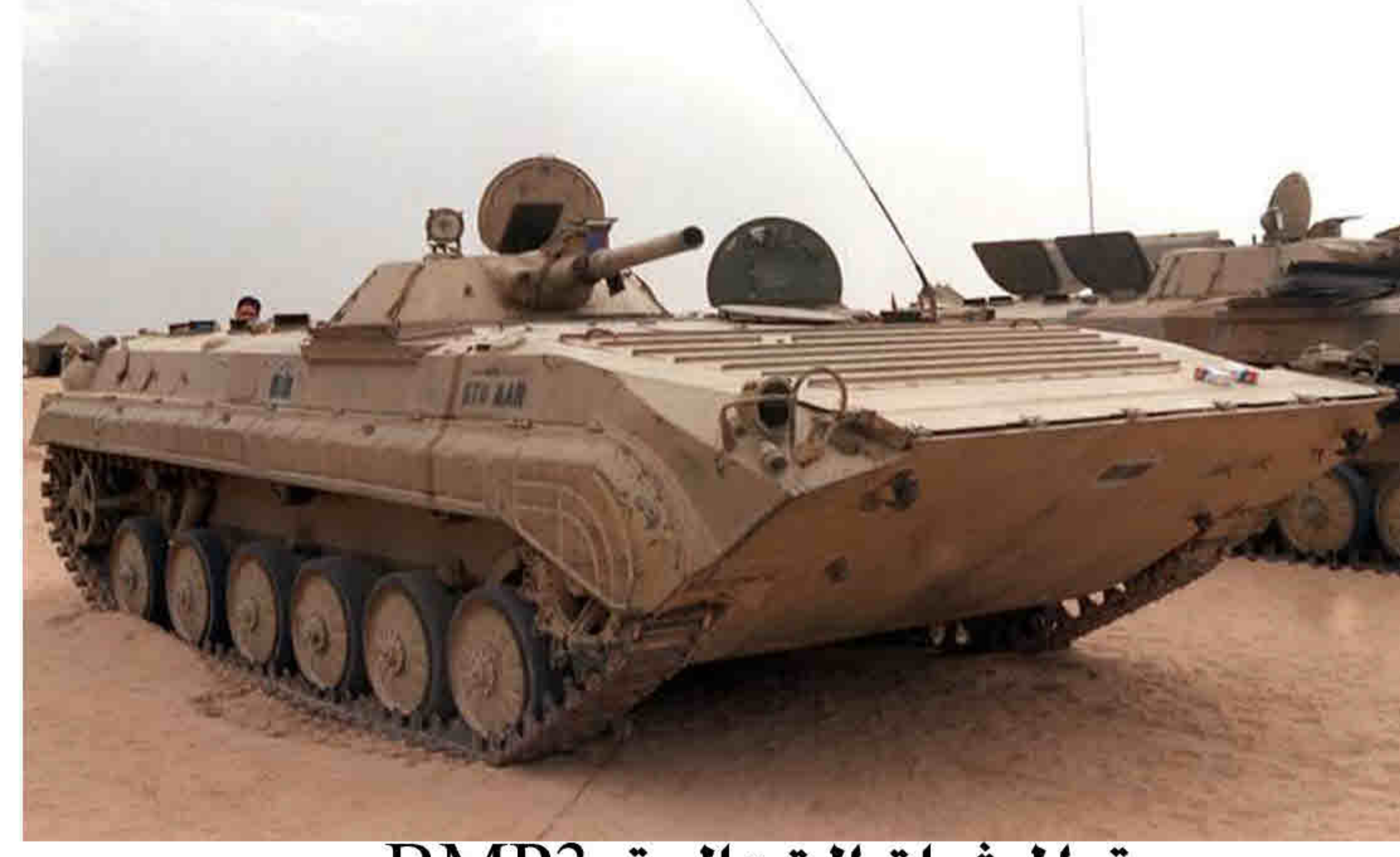
عربة المشاة القتالية BMP3

BMP-3 عربة برمائية صممت لتعقب ومشاغله الاهداف الارضية المدرعة من وضعيه النبات والحركة والعموم , وهي عربة ذات سرعه ولديها القدرة على المناورة براً وبحراً . يوجد من عربة المشاة القتالية BMP-3 ثلاثة طرازات أ- عربة القيادة BMP-3k / وهي تعتبر مثل عربة BMP-3 الاساسيه ولكن ركب عليها اجهزه اتصالات وملاحه اضافيه ب- عربة العمليات البرمائية الاكثر ثباتاً BMP-3f / ولقد تغير بنائها بحيث تسمح باطلاق النار بدقه من الحركة وهي عائمة ويمكن ان تستمر بالعمليات البرمائية لمدة سبع ساعات ج- عربة الاستطلاع Brm-3k / وهي عربة متخصصة بالاستطلاع البري وتعمل في الخدمة بالجيش الروسي بنظام الحماية الذاتية لعربة BMP-3:- جهازه العربة BMP-3 بنظام حماية يشمل على كشف وتتبع الهدف راداريات وعلى جهاز حاسوب ووحدة تشغيل وقائية للذخيرة . ويعمل نظام الحماية الياً حيث يتم نقل البنانات من الرادار الى الحاسوب والذي يقوم بدورة في السيطرة على الاطلاق وعدد الذخيرة . ويمكن للعربة ان تجهز موقع دفاعي يساعدها على مواجهة الاسلحة الموجهة المضادة للدبابات مع القيادة نصف اليه على مد البصر ) الهيكل الخارجي للعربة ان الهيكل والبرج مصنع من درع سباتك الالمونيوم , ومن ثم يتم تغطيه هذه السباتك بصفائح خارجيه فولاذيه مركبه على برج العربة وجوانبها واسفلها . ويوجد في العربة وحدة تهوية ذات مرشح للحماية م اسلحة التدمير الشامل وهذه الوحدة مركبة في المؤخرة , كما يوجد في العربة نظام تهوية الغاز والذي يعمل على طرد العادم مع خفض للبخار الحرارية