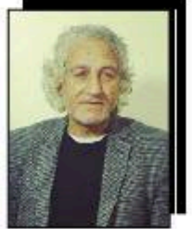
● دحام السظام

كان سورياً متميزاً.. وأيضاً كان كوردياً متميزاً..