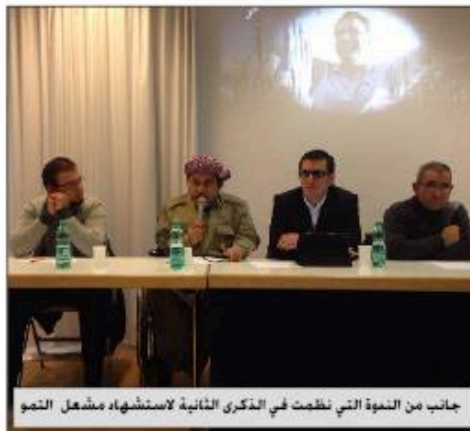
جانب من الندوة التي نظمت في الذكرى الثانية لاستشهاد مشعل التمو

تيار المستقبل الكردي في سوريا-منظمة أوروبا ٢٠١٣/١٠/٧ .