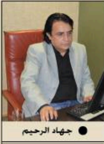
● جهاد الرحيم

استنطاع الأسد الأب خلال فترة حكمه منذ مطلع سبعينيات القرن الماضي، وحتى نهاية الألفية الثانية، أن يواد جميع الحركات المطالبة بالحرية والعدالة الاجتماعية، وكان سلاحه آنذاك شعارات كثيرة أهمها: