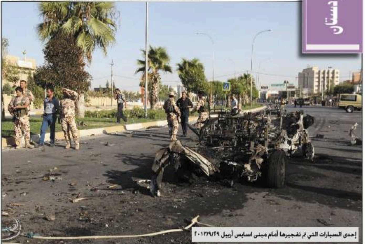
إحدى السيارات التي تم تفجيرها أمام مبنى آسایش أربيل ٢٠١٣/٩/٢٩