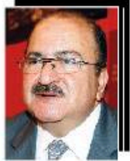
عبد الوهاب بدرخان

ستسجل "غينيس" أن بشار أول رئيس يبدي افتخاراً وسعادة وهو يرمي سلاحه "الاستراتيجي" في القمامة