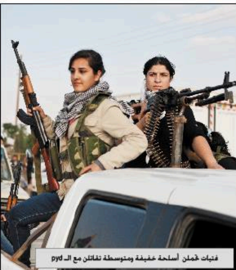
فتيات تحملن أسلحة خفيفة ومتوسطة ثقاتن مع الـ pyd

اليوم يأكل الابن ثمرة ما حصده أبوه الذكي ويستمتع بالقرش (الأبوجي) الذي خباه له ..