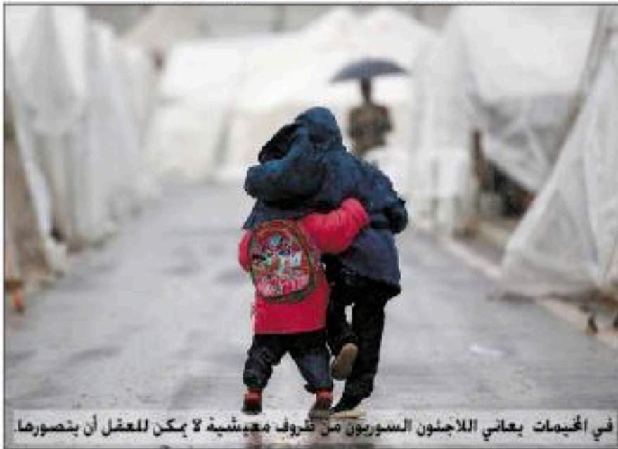
في المخيمات يعاني اللاجئون السوريون من ظروف معيشية لا يمكن للعقل أن يتصورها.