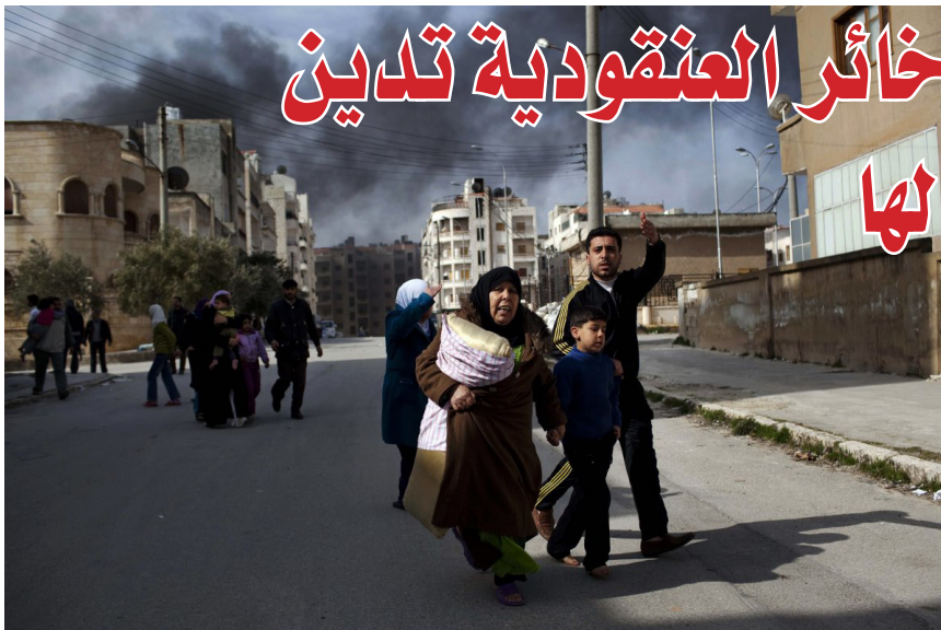
عائلة هاربة من قصف بالقنابل العنقودية | إدلب

بالتوقيع أو الالتحاق باتفاقية الذخائر العنقودية لسنة 2008، التي تحظر تلك الأسلحة وترد بها بنود إنسانية تشترط رفع مخلفات الذخائر العنقودية ومساعدة ضحاياها. وتعد 83 من هذه البلدان دول أطراف، ملزمة قانوناً بتنفيذ جميع بنود الاتفاقية. أما الدول الـ 29 الباقية فقد وقعت على الاتفاقية ولم تصدق عليها بعد، بمعنى أن عليها تعزيز هدف الاتفاقية وغايتها.