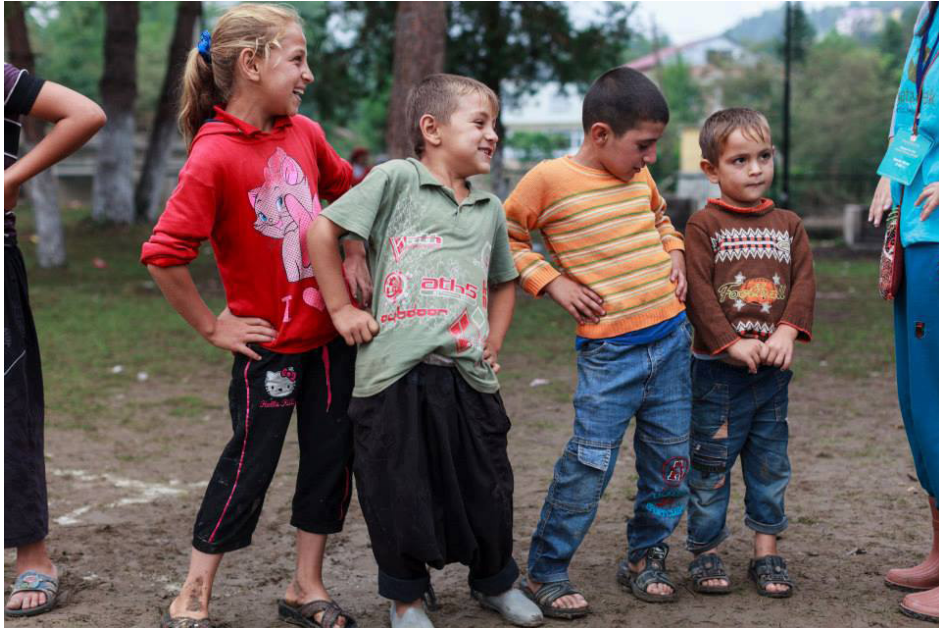
أطفال سوريون في طرابلس مع إحدى متطوعات اليونيسيف

وأشار البيان أن اليونيسيف ستنفذ هذا العام برنامجاً مبتكراً يستهدف نحو 400 ألف طفل متأثر بالأحداث غير قادر على الوصول إلى المدرسة حيث سيجري تقديم الدعم لهؤلاء الأطفال من خلال برنامج للتعليم الذاتي داخل المنزل.