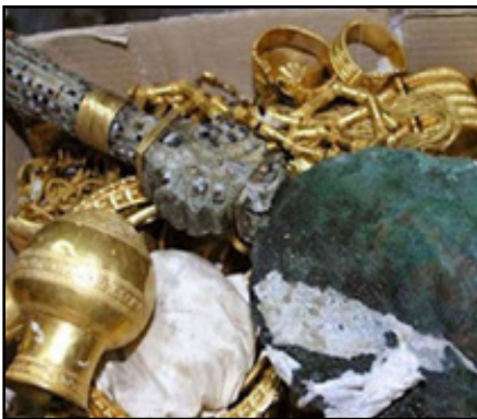
بقلم: ربيع الشام

وفي النهاية لا يسعنا أن نقول بأن حماية ما تبقى من الآثار والمتاحف هو أكثر أهمية من حماية مستودع للذهب أو مصرف للمال، فهو حماية إرث الأجداد، وحماية مصدر كبير دائم للدخل وفرص العمل.