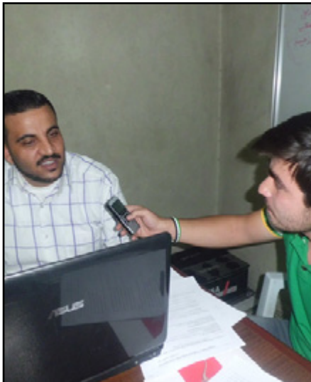
لقاء: عمر الحياة

نتمنى من الله عز وجل توحيد صفونا وتوحيد كلمتنا وتوحيد قلوبنا لأن التوحيد هو أساس كل شيء، نساهم بأي عمل جماعي فإن يد الله مع الجماعة، ويجب ألا نبقى متفرقين ولا متنازعين لأن مصيبتنا الحالية وتأخر الفرج والنصر متلخص بقوله تعالى: «ولا تنازعوا فتفشلوا وتذهب ربحكم»، والشعب عليه أن يصبر، ونرجو من الله الفرج والنصر.