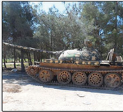
بقلم ربيع الشام

وكانت بعض الصفحات على مواقع التواصل الاجتماعي (شبكة اخبار مهين) قد نشرت أن الثوار استولوا على مستودعات مهين بريف حمص والتي تتألف من ٢٠٠ هنكار وكل هنكار احتوى على ذخيرة تتراوح بين ٤٠٠٠٠ و ٦٠٠٠٠٠ طن. وأضافت أن الثوار استطاعوا بفضل الله وتوفيقه نقل ٨٠٪ من هذه الغنائم إلى أماكن آمنة. ويضاف إلى ذلك الدبابات الروسية الحديثة التي غنمها الثوار، أو إن صح التعبير "استردها الثوار". حيث يمتلك الثوار دبابات من نوع تي ٧٢ وتي ٨٢ الأحدث بالترسانة السورية بحوزة الثوار.