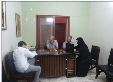
لقاء: عمر الحياة

نريد من جميع المنظمات التي تتعاون مع بعضها البعض، ونحن كفريق هنا سعيدين لخدمة الشعب السوري والمنظمات تخدم بعضها البعض، والاتحاد هو الأب الروحي لهذه الجمعيات والمنظمات، الدولة الجديدة سوف تكون صلة الوصل بين أفراد المجتمع والدولة.