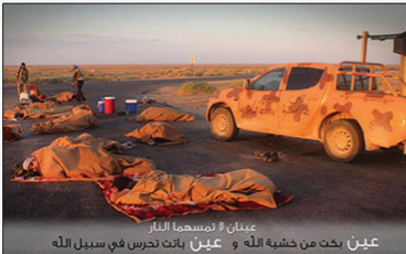
عينان لا تمسحهما النار

هذا قليل من كثير مما جاء عن فضل الجهاد ومنزلته في الاسلام.