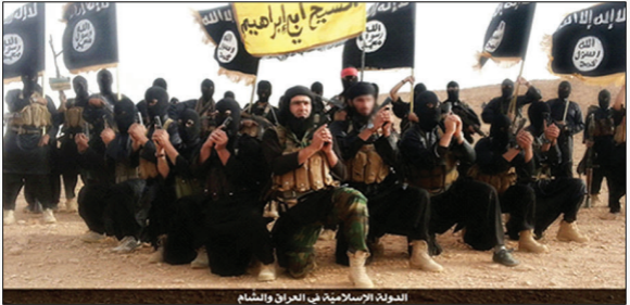
الدولة الإسلامية في العراق والشام

م، وسيتم استعمال هذه القناصة في الحرب مع النظام السوري. يذكر بأن لواء الإسلام كان سابقاً بالتقنيات العسكرية فقد قام بإصلاح مدرعة روسية مضادة للطيران بعد اغتنامها من النظام وأعلن على إثرها حظراً جويًا على غوطة دمشق، واستطاع اسقاط عدة طائرات حربية للنظام السوري بعد إعلان الحظر.