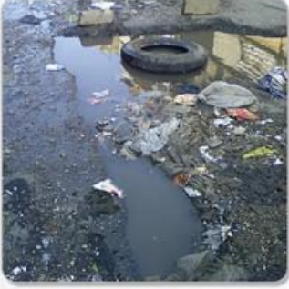
اصلاح الطرقات ضرورة خدمية الصفحة الثانية عشر