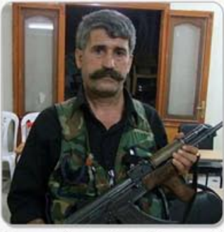
لقاء مع المجاهد أبو دجانه الصفحة السادسة