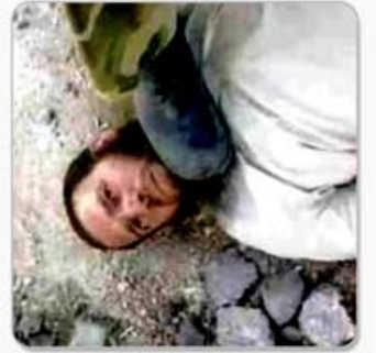
مذكرات معتقل الصفحة الرابعة عشرة