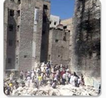
مجزرة بستان القصر الصفحة الثالثة