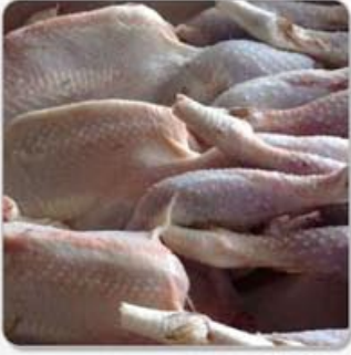
الفروج الايراني في سوريا الصفحة الرابعة