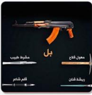
الثورة ليست فقط بندقية الصفحة السابعة