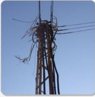
السرقة والكابلات الكهربائية الصفحة الثانية عشر