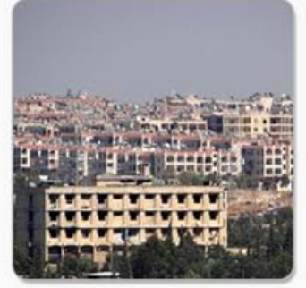
سرقة للمنازل و طرد للمدنيين الصفحة الرابعة