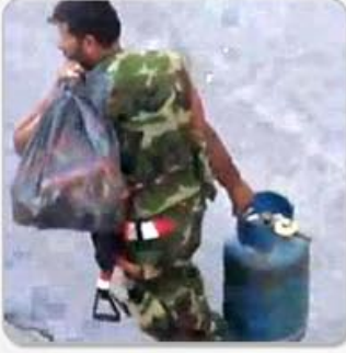
السرقة : ألم للشعب وتهمة للجيش الحر الصفحة الثالثة عشر