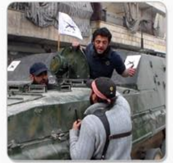
من هو "أبو عمارة"؟ الصفحة الخامسة