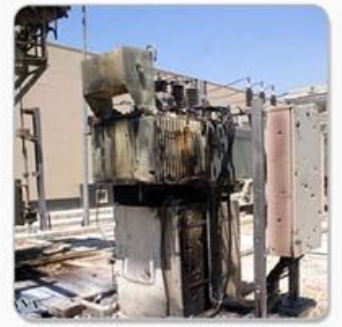
تأهيل محطة كهرباء جسر الحج الصفحة الثالثة

العدد السابع تاريخ 17 آب 2013 www.facebook.com/hibrpress