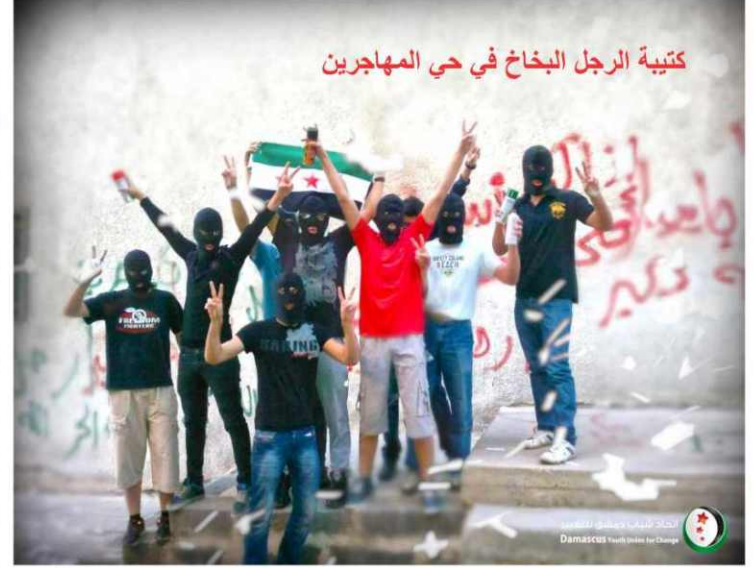
كتيبة الرجل البخاخ في حي المهاجرين