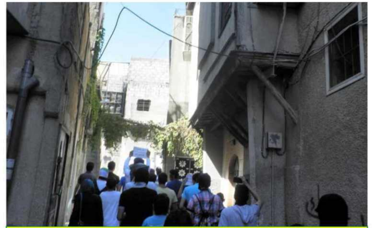
مظاهرة طلابية لأبناء الصالحية

مناطق الصالحية حساسية فخرجت المظاهرات أمام مبنى البرلمان وأمام فرع الأمن السياسي كما خرجت في أحياء الصالحية العليا لتقوض مضجع عصابة الأسد، أما في ركن الدين فقد حافظت المظاهرات على صعود خطها البياني تنظيمياً وكثافة وظهرت بارات الرجل البخاخ في شرقي ركن الدين وعادت المظاهرات الطلابية بكثافة أكبر وتصميم أعلى على اقتلاع العصابة الأسدية.