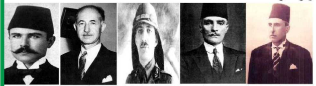
الرئيس شكري القوتلي إبراهيم هنانو يوسف العظمة سعد الله الجابري فارس الخوري

هيكال الخلد لا عدتك العوادي الأياحي *** أنت إرث الأمجاد للأمجاد سعد: يا سعد إنه لنداء *** من حين فهل عرفت المنادي أنا يا سعد ما طويت على اللوم *** جناحي ولا جرحت اعتقادي شنيهد الله ما انتقدتلك إلا! *** طمعا أن أرك فوق انتقادي وكفي المرء رفعة أن يعادى *** في ميادين مجده ويعادي وقريبا بإذن الله ستحقق سوريا استقلالها الثاني من المحتل الأسدي وسيظهر بإذن الله شخصيات وطنية نحمل على عاتقها بناء هذا الوطن الغالي وازدهاره،