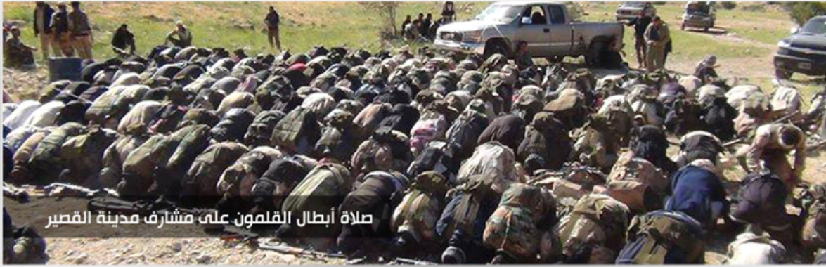
صلاة أبطال القلمون على مشارف مدينة القصير