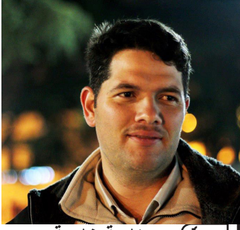
النبا • متابعة خاصة