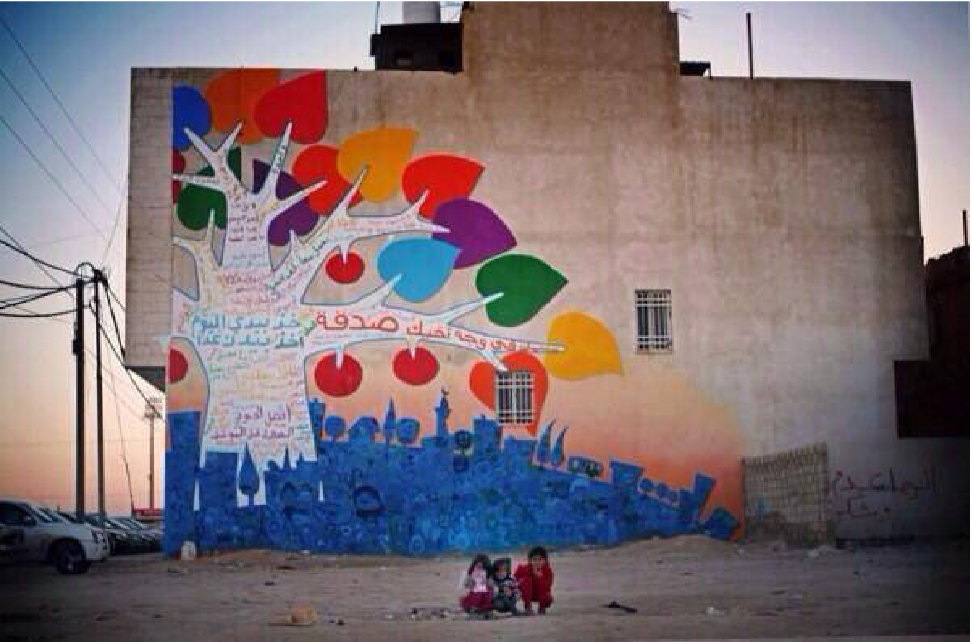
الصورة من مخيم الزعتري