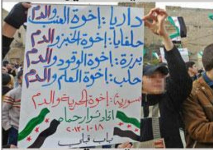
حماة - باب قبلي