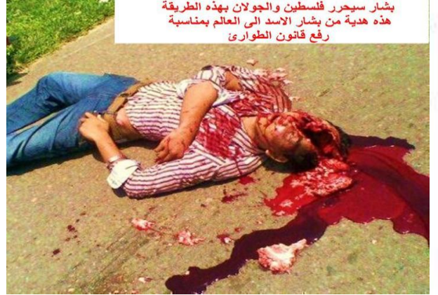
بشار سيجر فلسطين والجولان بهذه الطريقة هذه هدية من بشار الاسد الى العالم بمناسبة رفع قانون الطوارئ