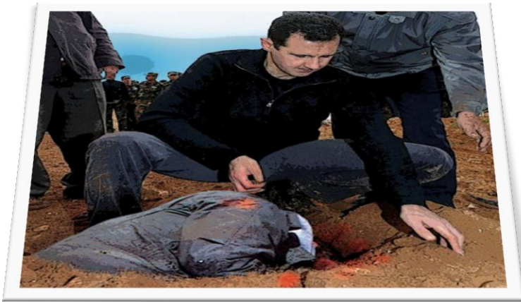
لقطة تذكارية للطاغية الأسد..

وركضت إلى الخنة أعانقتها وأبكيها فما كان من المحقق إلا أن أمر عناصره بسحب واقتيادي إلى غرفة التعذيب..