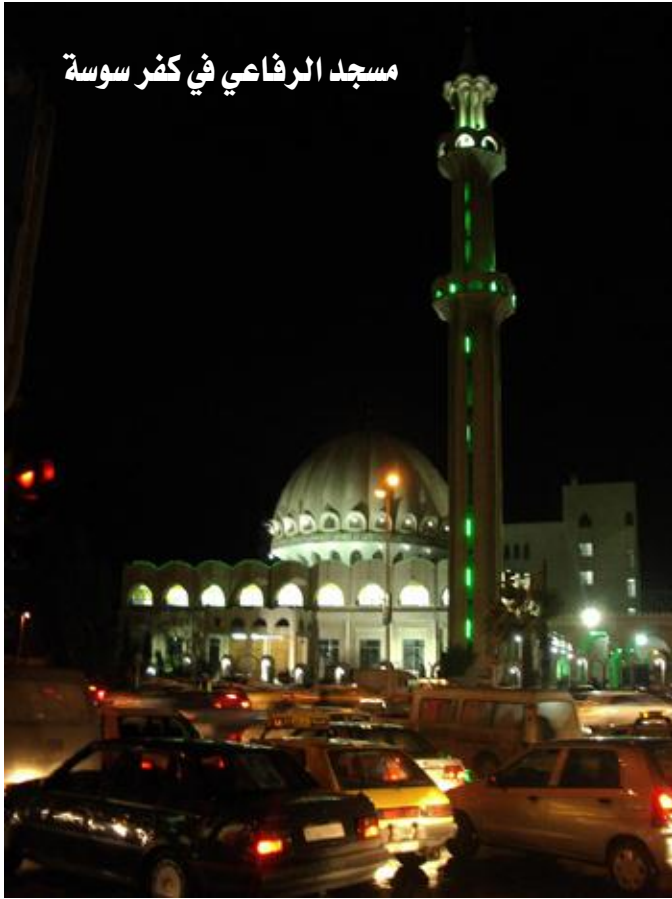
مسجد الرفاعي في كفر سوسة