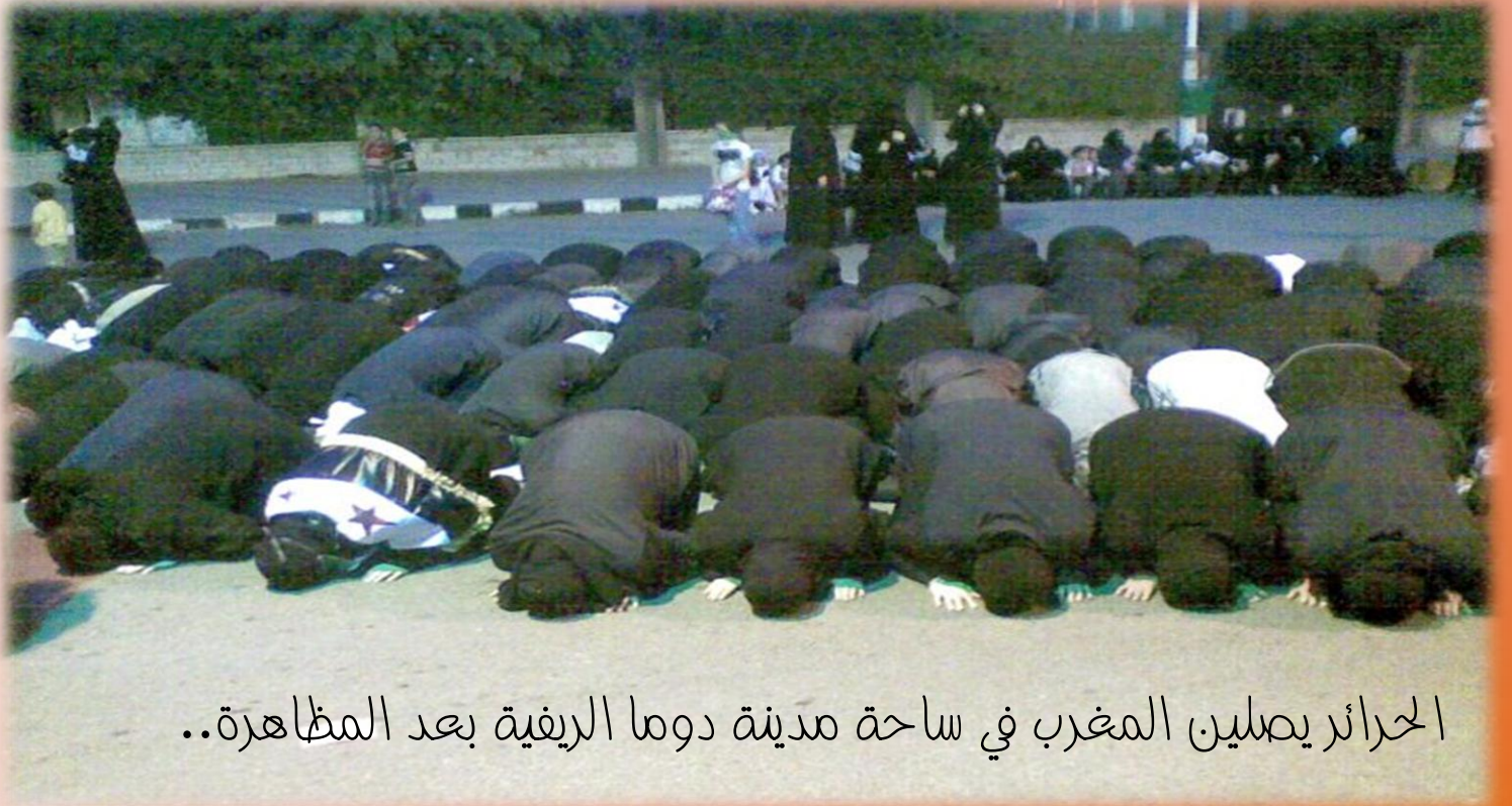
الحرائر يصلين المغرب في ساحة مدينة دوما الريفية بعد المظاهرة..

كفوا الملام فمقلتي الشام لو خيرت بين الخلود وحبها كفوا الملام فإن قلبي عاشق أو ما رأيتم جدّها وجهادها أو ما رأيتم كالجدود دماءها أو ما رأيتم بالتظاهر صبرها أو ما رأيتم يا شعوب شجاعة أو ما رأيتم عزمها فوجدتم شعب فضائله بغير كلامنا والله خلدها بوحى كتابه حضن النبوة في جميع بقاعه جعل الإله به ممالك أمة واليوم ينهض بالجهاد مكبراً الشعب أسد، والنظام طريده والحق يؤخذ بالدماء وغيرها يا مشعل الثورات يا شام العلا والله أقسم لن يضيع جهادكم