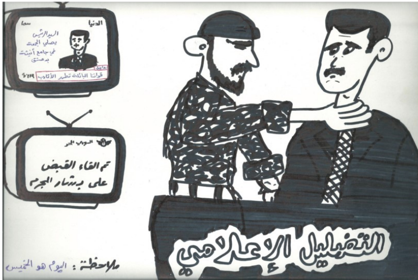
ملاحظة: اليوم هو الخميس