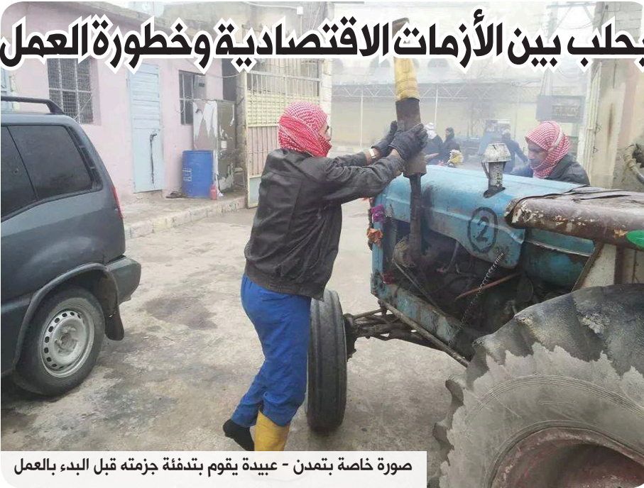
عبيدة يقوم بتدفئة جزمته قبل البدء بالعمل