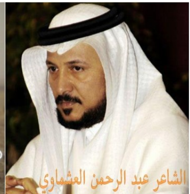
الشاعر عبد الرحمن العشماوي

نتساقى دموعنا في اكتئاب ألقمتنا حضارة العصر رملاً ورمقنا فريسةً للكلاب فأمنحونا يا قومنا نصف ثوب وبقايها طعامكم والشراب أيها المعرضون عنا ، رويداً فسنلقى الجميع يوم الحساب أيها اللابسون أغلى الثياب في بيوت وثيقة الأبواب هل لديكم ثوب قديم لأختي فلقد زاد في الشتاء عذابني أفقدتنا قنابل الظلم أهلاً دفنتهم تحت الحصى والتراب فاتخذنا الرصيف داراً وبتنا