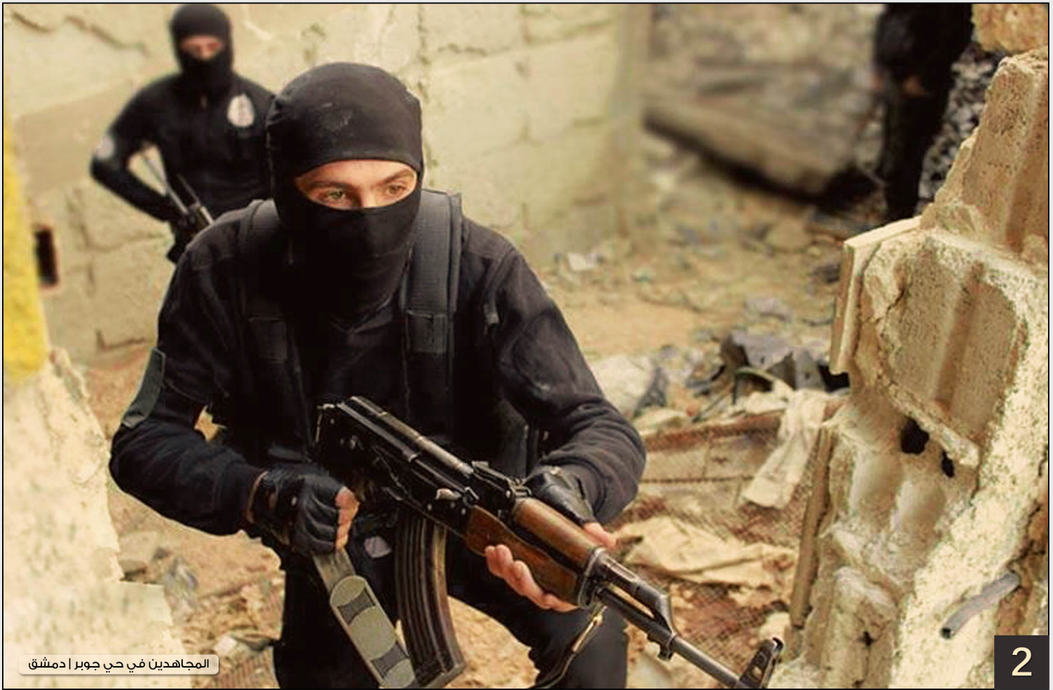
المجاهدين في حي جوبر | دمشق