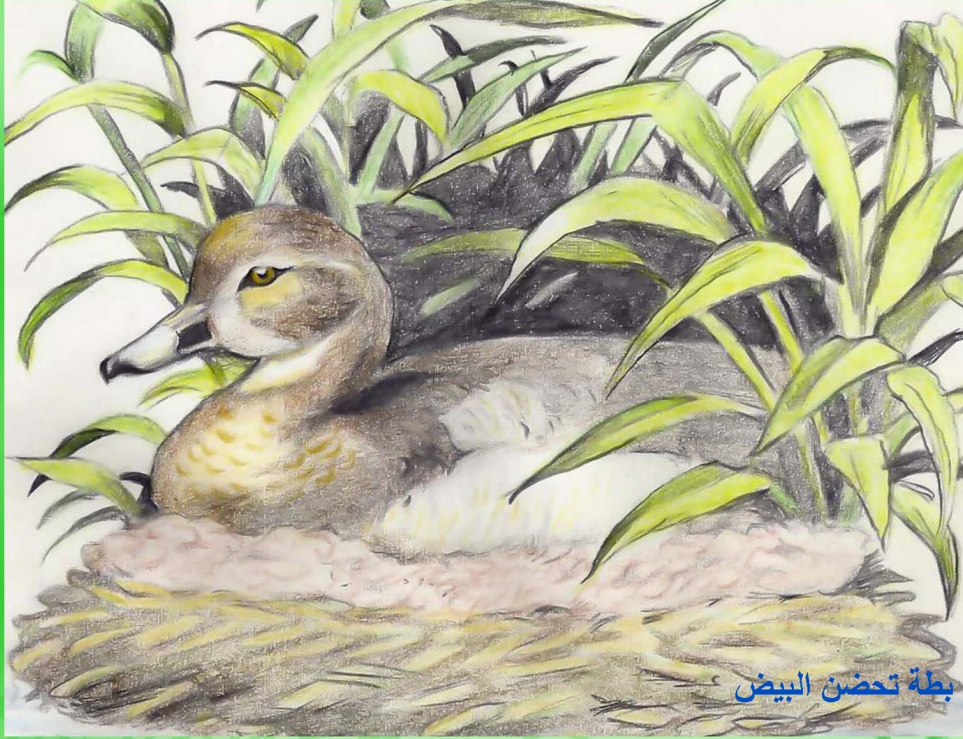
بطة تحضن البيض

يعد البيط من الطيور المائية حيث يعيش بالقرب من المياه على شواطئ البرك والأنهار أما البيط الداجنة فتعيش في المزارع والحظائر ونحصل منها على البيض واللحم تكون مناقيرها مفلطحة لتتغذى على الأعشاب والديدان والضفادع والقواقع ويتميز ريش البيط بأنه عازل للماء