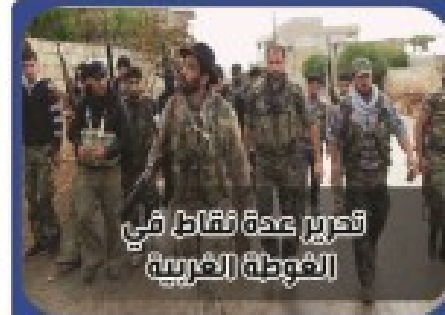
تحرير عدة نقاط في القوطة الغربية