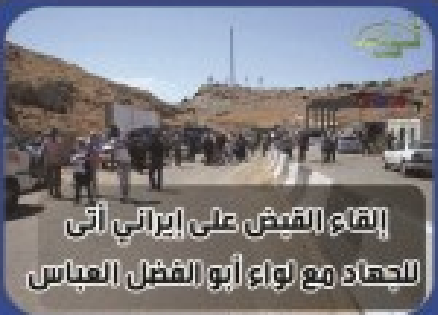
إلقاء القبض على إيراني أتى للتحادث مع لواء أبو الفضل العباس

نظراً لارتفاع التكاليف الطباعة والورق نأسف أنه سيصبح سعر النسخة 10 ليرات سورية ابتداءً من يوم السبت القادم 22 ذي القعدة 1434هـ الموافق 28/09/2013 م