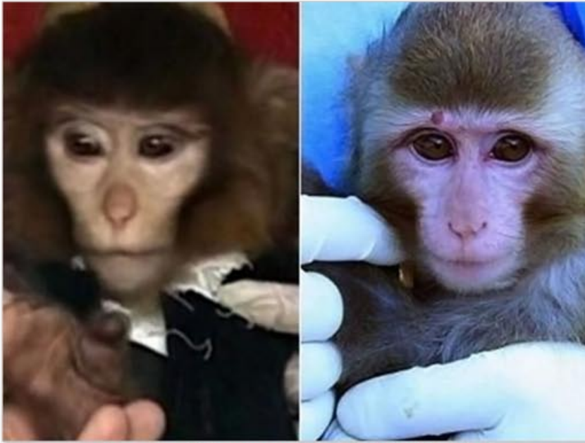
على اليمين القرد الذي تم إرساله وعلى اليسار القرد بعد عودته

تحدثنا في العدد الماضي عن اختلاق إيران لكذبة آلة الزمن وتزوير إطلاق الصواريخ التي لم تنطلق باستخدام الفوتوشوب. طموح إيران لا يتوقف عند اختراع ماشين زمان أو إطلاق صواريخ وإلى آخره، طموحات إيران أعلى من قمم الجبال. أذاعت قناة المنار هذا الإنجاز العظيم: "تمكنت الجمهورية الإسلامية إيران من إرسال قرد إلى الفضاء وإعادةه حياً إلى الأرض، وقد تم إرسال القرد على متن مسبار على الصاروخ كاوشكر في خطوة وصفها وزير الدفاع الإيراني بالإنجاز الكبير الذي يفتح المجال أمام استكشاف الفضاء، حلق الصاروخ على ارتفاع ١٢٥ كم وعاد إلى الأرض بسلام". الإنجاز ليس فقط بإرسال القرد إلى الفضاء وإعادةه حياً، وإنما أرسلته إلى الفضاء صبغت شعره بلون أغمق وأجرت له عملية تجميل صغيرة بوجهه وأرسلته إلى الأرض، هذا هو الإنجاز، فكما نلاحظ في الصورة القرد الذي على يمين الصورة هو الذي ذهب إلى الفضاء والقرد الذي على اليسار هو الذي عاد، نلاحظ أن لون الفراء أصبح أغمق، كما أن الحبة التي فوق جبينه أزيلت بالإضافة إلى ذلك عملية الأنف وإزالة التجاعيد التي حول عينيه. صحيح أن أميركا أرسلت قرداً إلى الفضاء لكن إيران أرسلت قرداً إلى الفضاء وأجرت له عملية تجميل وإعادةه إلى الأرض حياً. طبعاً يوجد احتمالات أخرى أقل أهمية وهي أن القرد مات فغيروه في المؤتمر الصحفي أو أنهم أصلاً لم يرسلوا قرداً ولا يوجد صاروخ، وكل القصة مثلها مثل قصة الطائرة أو الصواريخ التي لم تطلق.