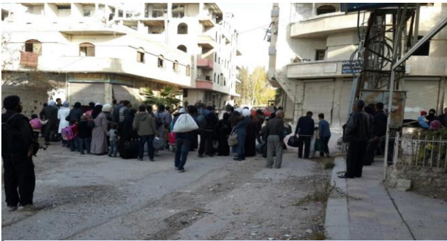
محاولة الأهالي الخروج عن طريق زبدين - المليحة

تزامناً مع ذلك سيطرت كتائب الثوار على منطقة (المعامل) على أطراف البلديتين.