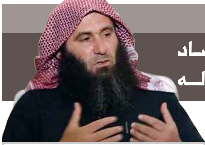
الشيخ توفيق شهاب الدين، قائد حركة نور الدين الزنكي