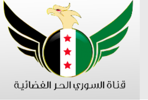
قناة السوري الحر الفضائية

أن تكون طائر نورس هو أن تكون سورياً مؤمناً بالحرية، لا يهيمك لا نظام ولا معارضة، لا تعنيك العناوين العريضة أو التفاصيل، لا تكتثر كثيراً بما يكسبه الآخرون، فأنت تكفيك سمكة واحدة، وفي الأخير سيكتب الشعراء أنك أنت لا عن الدواجن، هل سمعتم عن شاعر كتب قصيدة عن دجاجة مثلاً؟ وسيرسمك الرسامون، وسيلتقط صورتك المصورون، ولن يكتروا لأمر الدواجن التي ما زالت قابضة في القفص، أو تلك التي تبحث عن قفص جديد، وعن ديك جديد يحكمها.