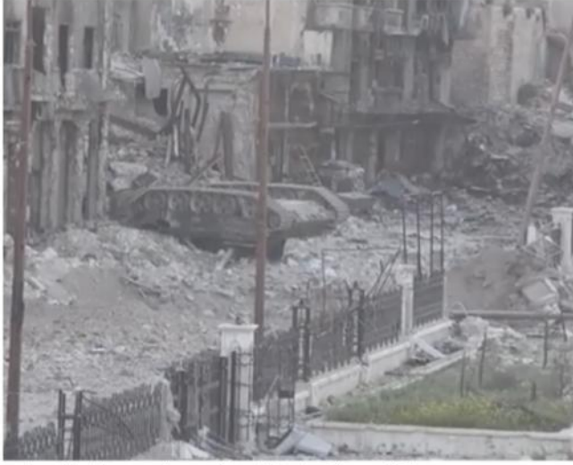
إنقلاب دبابة تابعة للنظام بعد استهدافها في حلب

وأوضح ناشطون في حلب أن أهمية تحرير جبل شوخنة تكمن في كونه خط الدفاع الرئيس للنظام لكتائب المدفعية في جمعية الزهراء. والتي منها تقصف قرى وبلدات في ريف حلب الشمالي والغربي. كما استمر التقدم من محور غرب المدينة حيث تمكن الثوار من السيطرة على صالات الليمون وبات فرع المخابرات الجوية تحت مرمى نيران الثوار.