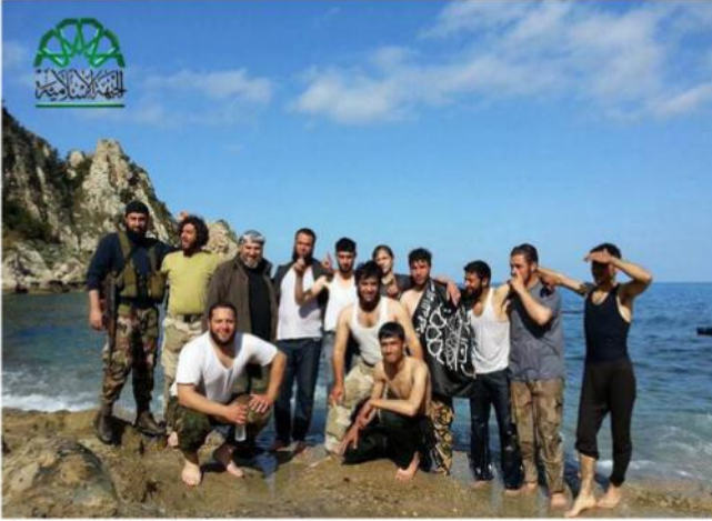
الثوار على شاطئ المتوسط

كذلك. عمد النظام إلى إتباع طريقة المراسد ذاتها. في المنطقة المحيطة بجبل الأكراد. حيث قام بنشر مجموعة مراصد تمتد من بلدات إنباتة وبارودة وتلا. وصولاً إلى قمة النبي يونس. التي تعد النقطة الاستراتيجية الأهم والأعلى في الساحل السوري. حيث تبعد ٨ كيلو متر فقط. عن مدينة القرداحة. مسقط رأس الرئيس السوري بشار الأسد. وتشرف على مدن اللاذقية. والحفة وجبله وريفها. التي تعتبر الخزان البشري الأضخم لدعم النظام .