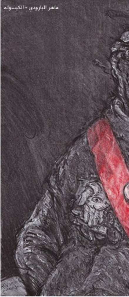
ماهر البارودي - الكبسولة

بالنسبة لمصر تندرج مسألة تأهيل نظام الأسد ضمن خطة واسعة لإعادة الدور المصري وترتكز على جملة من المحاور: بناء مجال إقليمي أمني وسياسي طارد للإخوان المسلمين في المنطقة من ليبيا غرباً إلى سورية شرقاً، وخلق محور موازي لما تعتقده محور مضاد قطري - تركي تشكل سورية جبهته الشرقية، وهذه الترتيبات في حال نجاحها من شأنها إعادة فعالية الدور المصري،