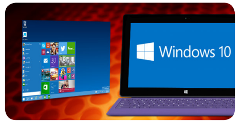
مايكروسوفت أعلنت مسبقا من فتح التسجيل

من خلال برنامج Windows Insider Program لتجربة نظام الويندوز العاشر النسخة الاستعراضية والآن مايكروسوفت ذكرت من أن هنالك أكثر من مليون شخص قام بالتسجيل لتجربة هذه النسخة طبعا الرقم يمثل فقط عدد المسجلين ولم تذكر مايكروسوفت الرقم الخاص بتثبيت النظام