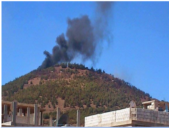
تل الحارّة قبيل تحريره من عصابات الأسد

يذكر أنّ حركة أحرار الشام الإسلامية أعلنت عن معركة "زئير الأحرار" والتي تهدف إلى ضرب مناطق للجيش، وفتح الطريق لضرب معامل الدفاع والسيطرة عليها وبذلك يتم قطع خط الإمداد الرئيسي للنظام على حلب.