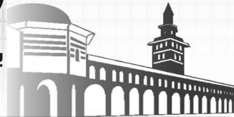
أول جريدة يومية في الثورة السورية

الفجر ٥:٠٥ الشروق ٦:٤٢ الظهر ١٢:٢١ العصر ٣:١١ المغرب ٦:٠١ العشاء ٧:١٩