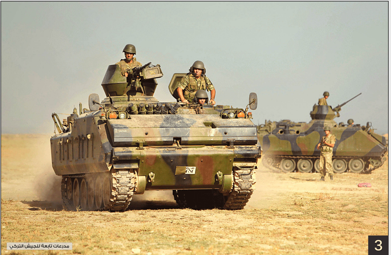
مدرعات تابعة للجيش التركي