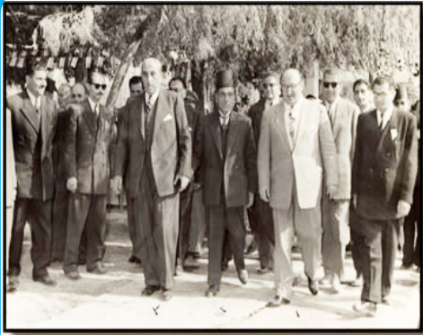
نرشح مشفى بيروت الوطني عام ١٩٥٥ م