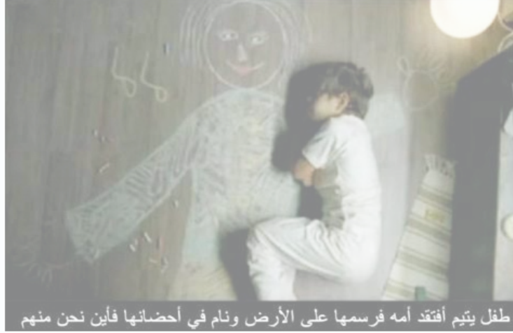
طفل يتيم افتقد أمه فرسمها على الأرض ونام في أحضانها فأين نحن منهم

أَيْنَ أَبِي ؟ وَهَلْ سَيَعُودُ لِيَقْصَّ لِي قِصَصاً فِي فِرَاشِي بَعْدَ افْتِرَاشِهِ التُّرَابِ .. وَهَلْ سَيَعُودُ أَنْفَاسُ