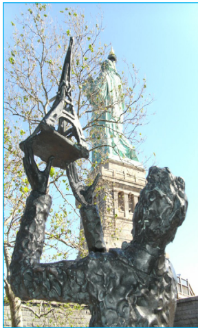
تمثال أمريت يديه ظهره لنا

اغفر لي يا أحمد سابقى هنا في زمن الغربة هذا لعل الفجر ينبلج بسرعة .. لعل الليل يمضي .. لعل الربيع يأتي بعد شتاءٍ طويل .. سامحني ... لعل غربة الوطن تعطينا بعض الدفء .