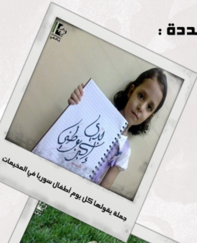
جملة يقولها كل يوم أطفال سوريا في المخيمات