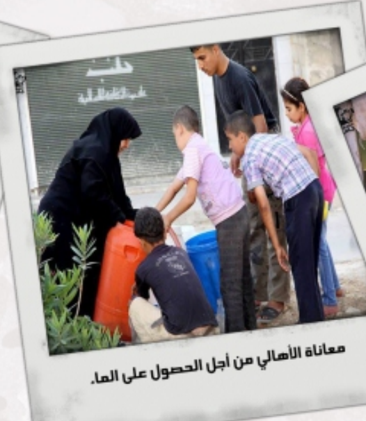
معاونة الاهالي من أجل الحصول على الماء.