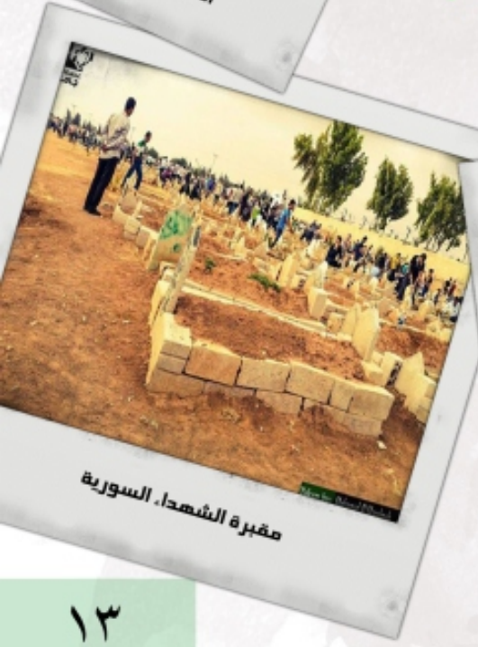
مقبرة الشهداء، السورية