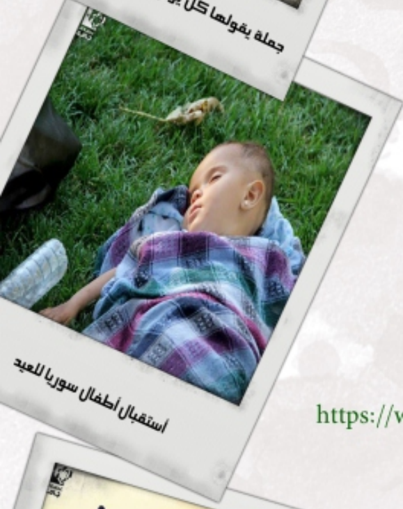
استقبال أطفال سوريا للعيد