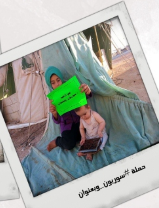
حملة #سوريون... وبعنوان