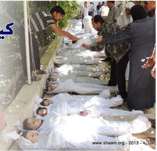
حجازرة - 2013 - www.shaaam.org

وخلال ساعات خرج لافروف ليعلم عن مبادرة روسية تستند على تصريحات كبرى بوضع ترسانة الأسد الكيماوية تحت الرقابة وتدميرها ما وافق عليه المعلم خلال ساعتين، حصل هذا كله في تزامن مريب أوحى لكل المراقبين أن شيئاً ما كان متفقاً عليه بين (الكبار) ورجح معظمهم أن ذلك تم على هامش اجتماعات قمة العشرين في سان بطرس بيرغ الروسية.