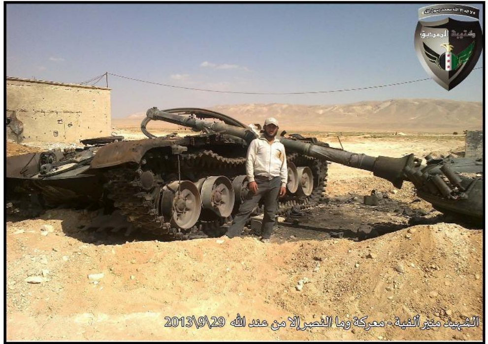
الشهيد مثير النمية - معركة وما النصر إلا من عند الله 29/9/2013