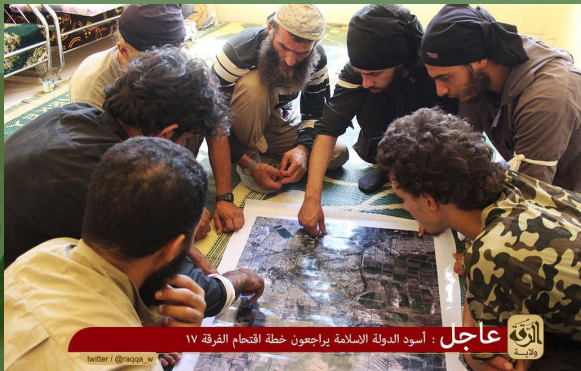
عاجل : أسود الدولة الإسلامية يراجعون خطة اقتحام الفرقة ١٧