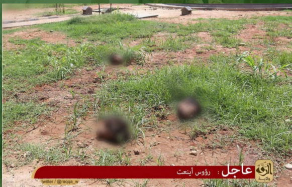
عاجل : رؤوس أينعت