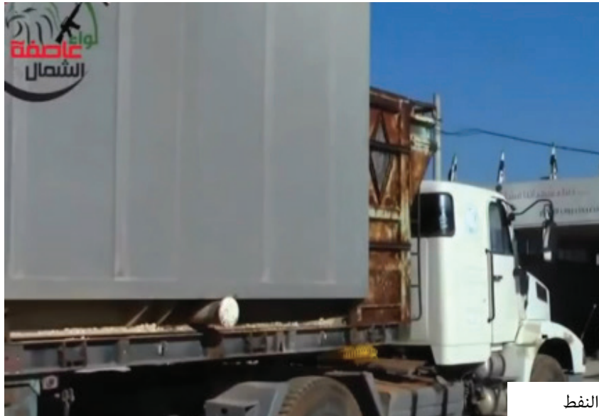
تهريب حفارات النفط

في هذا التقرير نحاول أن ننقل ما جرى في إزاز كما حدث على الأرض بالإضافة إلى استطلاع آراء المدنيين في المدينة.