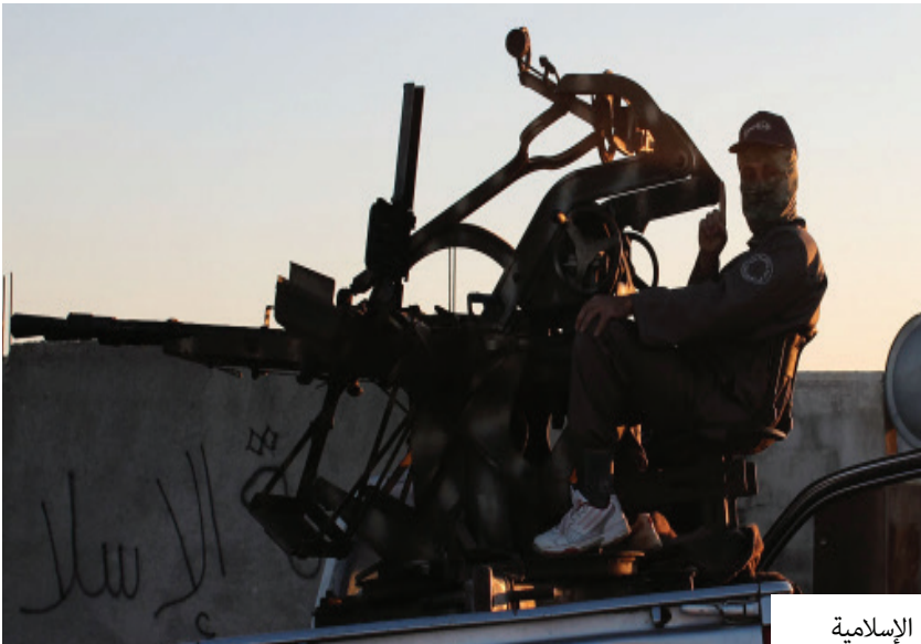
استعدادات الدولة الإسلامية

* تم القبض على عدة جواسيس من عاصفة الشمال ثبت تعاملهم مع المخابرات الامريكية وهذا موثق ضمن تسجيل مصور وسيتم عرضه قريباً على الانترنت.