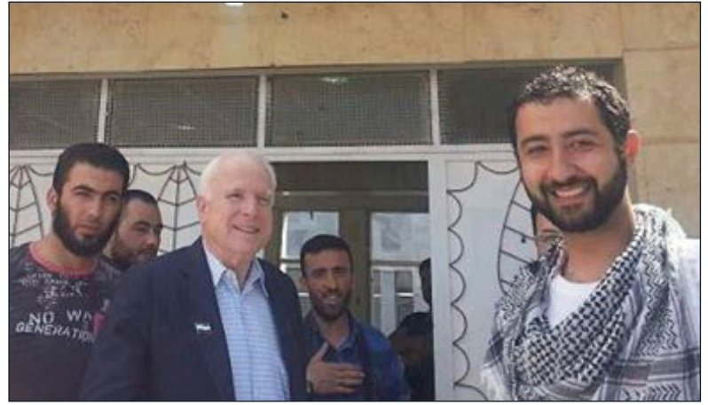
السيناتور جون ماكين في معبر باب السلامة في إزاز

في هذا التقرير نحاول أن ننقل ما جرى في إزاز كما حدث على الأرض بالإضافة إلى استطلاع آراء المدنيين في المدينة.