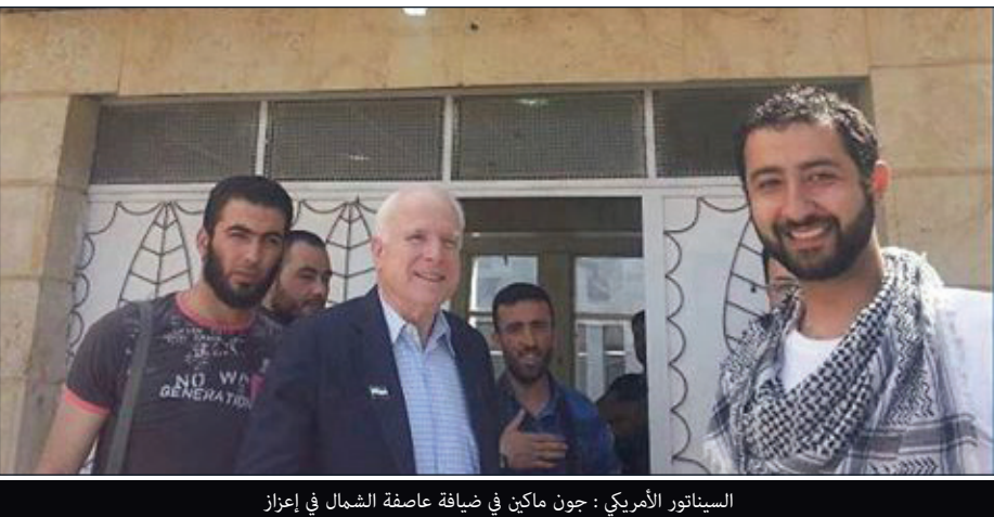
السيناتور الأمريكي : جون ماكين في ضيافة عاصفة الشمال في إعزاز

العالم في أسبوع - الدولة الإسلامية في العراق والشام تسيطر على ٤٠٪ من الأنبار . - اعترافات «نصر الله» الحزب لن يستطيع حسم الصراع عسكرياً في سوريا. - مقتل وزير باكستاني وسبعة آخرين بهجوم استشهادي. الصفحة ٧