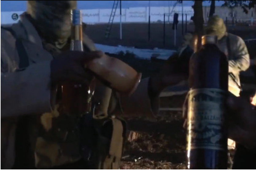
زجاجات الخمر في أحد معسكرات عاصفة الشمال بعد السيطرة عليها

* سرقة ونهب الاغاثة وعدم توزيعها على المسلمين واذلال الناس رغم ان هذا حق لهم. * تضيق الخناق على أهلنا في معبر السلامة من سلب للأموال وتحرش بالنساء وقهر للرجال. وجاء في البيان أيضاً دعوة لعناصر «عاصفة الشمال» إلى التوبة إلى الله: «ونقول لعاصفة الشمال ان باب التوبة مفتوح ولقد تم إطلاق سراح أكثر من ٣٠ عنصراً من عناصر عاصفة الشمال بعد اعلان توبتهم ورفضهم القتال ضد المسلمين. لذلك فكل من اتانا تائباً وسلم سلاحه قبل القدرة عليه قبلت توبته، والا فاننا عازمون بعون الله تعالى على استئصال شافتهم.»