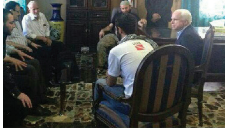
السيناتور جون ماكين في ضيافة عاصفة الشمال

ضجت وسائل الإعلام المؤيدة منها والمعارضة بالأحداث التي جرت في مدينة إزاز، وقد ظهر جلياً كيف عملت كل وسيلة إعلامية على تشويه الحقائق وتسخيرها لخدمة أغراضها الخاصة.