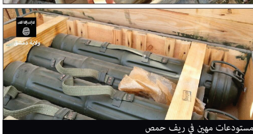
غنائم المجاهدون من مستودعات مهين في ريف حمص