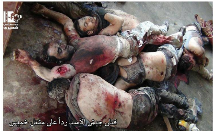
قتلى جيش الأسد رداً على مقتل خميس

تبع هذه الحادثة اضطراب و توتر في المدينة فيما رد الجيش الحر باستهداف ضباط و عناصر تابعين لمطار الضمير فقتلوا منهم خمسة .. تبع ذلك تحليق للطيران الحربي و القاء صاروخين قرب المبيضة لم يحدثا أضراراً و قصف المدينة بقذائف الهاون التي سقط معظمها في "حارة العرب" .