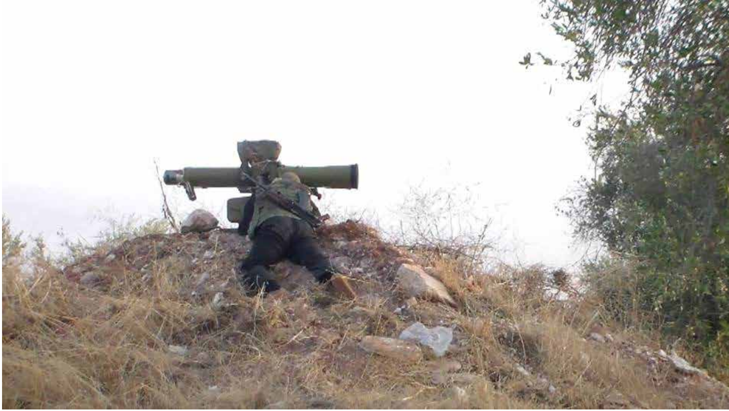
معارك مورك

أفشلت فصائل الجيش الحر بمساعدة كتائب إسلامية، خلال الأيام القليلة الماضية، محاولات عدة لعناصر القوات النظامية وحزب الله للسيطرة على مدينة مورك في ريف حماة الشمالي، التي تشكل أهمية كبيرة للنظام، لكونها طريق إمداد رئيسي لمدينة معرة النعمان، معززة من تواجدها في المدينة من خلال ضمان أطرافها. تأتي هذه التطورات بجانب معارك مهمة تخوضها فصائل المعارضة في درعا جنوبي البلاد، تسعى من خلالها إلى ضمان الريف الغربي والشرقي، وحصار القوات النظامية وقطع الإمداد عنها، بينما شهدت مناطق بريف دير الزور الغربي سيطرة مؤقتة للنظام، قبل أن يستعيدتها تنظيم "الدولة الإسلامية" من جديد، فيما يبدو أنها محاولة لجس النبض، بعد ضمان سيطرة عناصر التنظيم على معظم محافظة دير الزور.