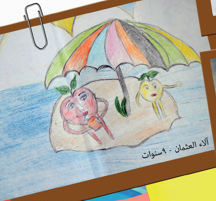
آلاء العثمان - ٩ سنوات