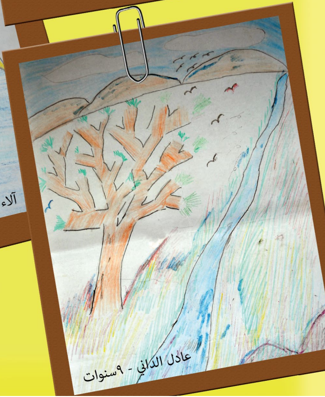
عادل الدكاني - ٩ سنوات