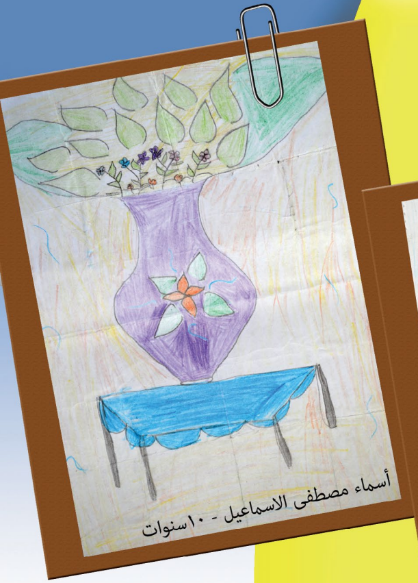
أسماء مصطفى الاسماعيل - ١٠ سنوات