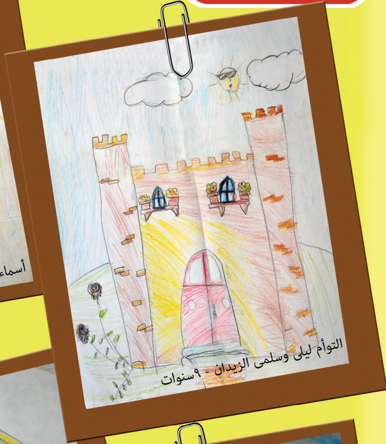
التوأم ليلى وسلمى الزيدان - ٩ سنوات