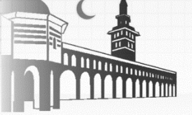
أول جريدة يومية في الثورة السورية